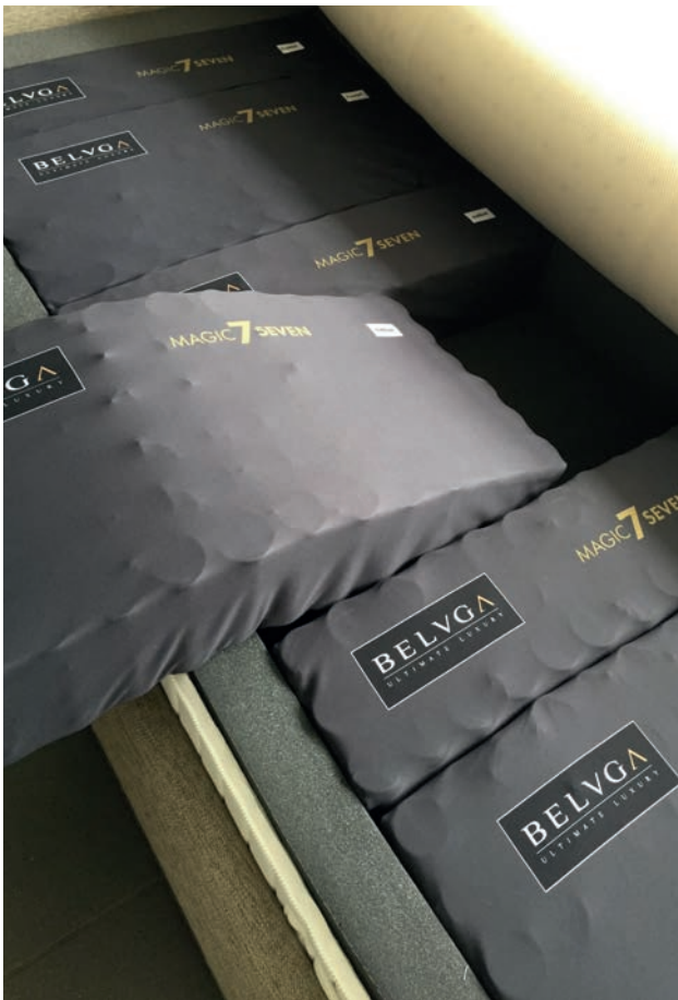
Einfach und schnelles Wechsel der Module